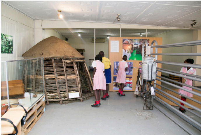
Die Ausstellung "Drink Deeply! Milk Exhibition" im Uganda Museum kommt nicht zuletzt auch bei jüngeren Besuchern sehr gut an.

transcript Verlag, Bielefeld & Fountain Publishers, Kampala. Das Buch enthält in der Mehrzahl Beiträge afrikanischer Wissenschaftler und Wissenschaftlerinnen und Museumsleute und ist eines der Resultate einer internationalen Konferenz von Dezember 2016. Sowohl die Tagung wie die Publikation wurden von der Schweizerischen Gesellschaft für Afrikastudien SGAS gefördert. Der Band soll Ende Juni 2018 erscheinen.